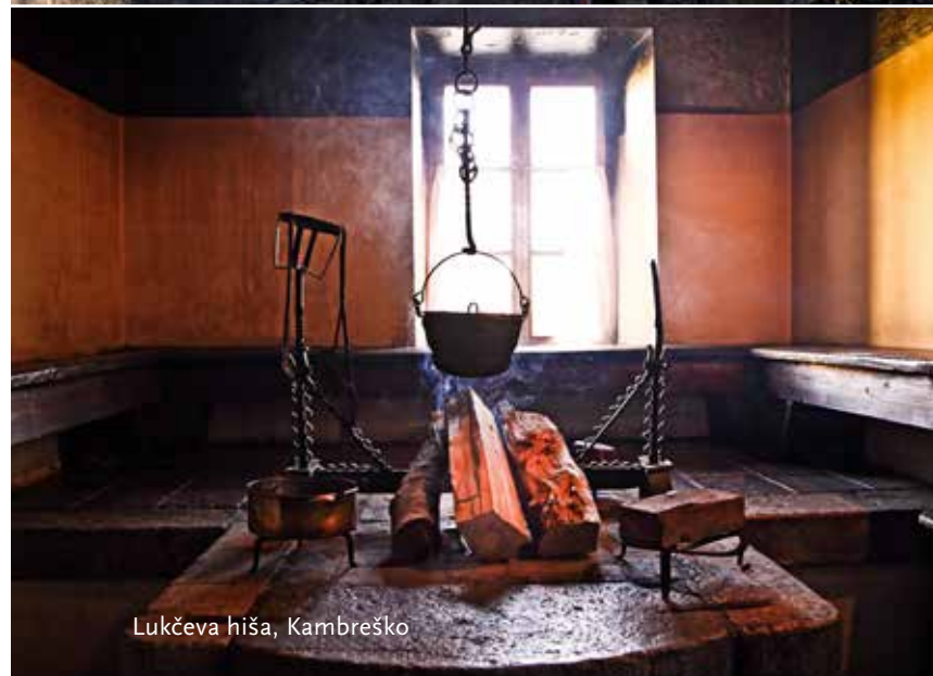
Lukčeva hiša, Kambreško