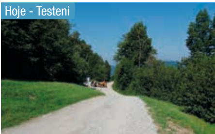
Hoje - Testeni

V Občini Kanal ob Soči pospešeno tečejo dela tudi na področju gradnje nove komunalne infrastrukture. Trenutno poteka gradnja novega vodovodnega odseka med naseljema Hoje in Testeni , kjer se bo položilo skoraj 1200 metrov novih vodovodnih cevi in uredilo hišne priključke. Investicija, ki znaša 346.161,21 evrov, zajema tudi ureditev nove asfaltne prevleke ceste na celotnem območju posega.