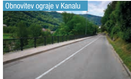
Obnovev ograde v Kanalu