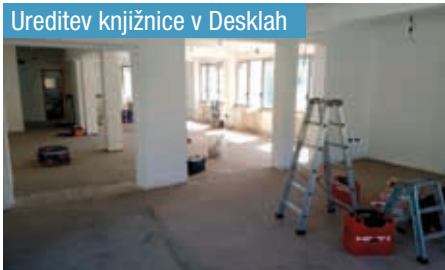
Ureditev knjižnice v Desklah