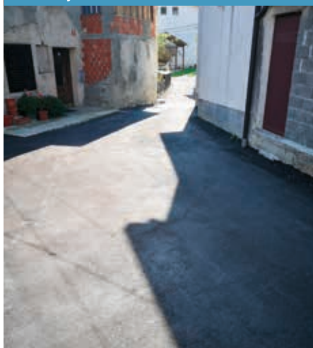
Ureditev meteorne in fekalne kanalizacije in asfaltacija cestišča v Avčah