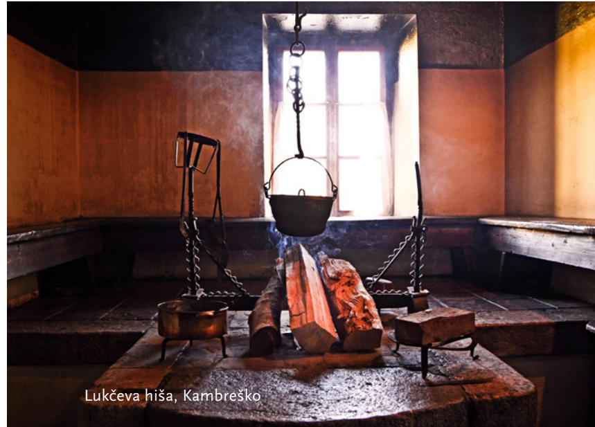
Lukčeva hiša, Kambresko