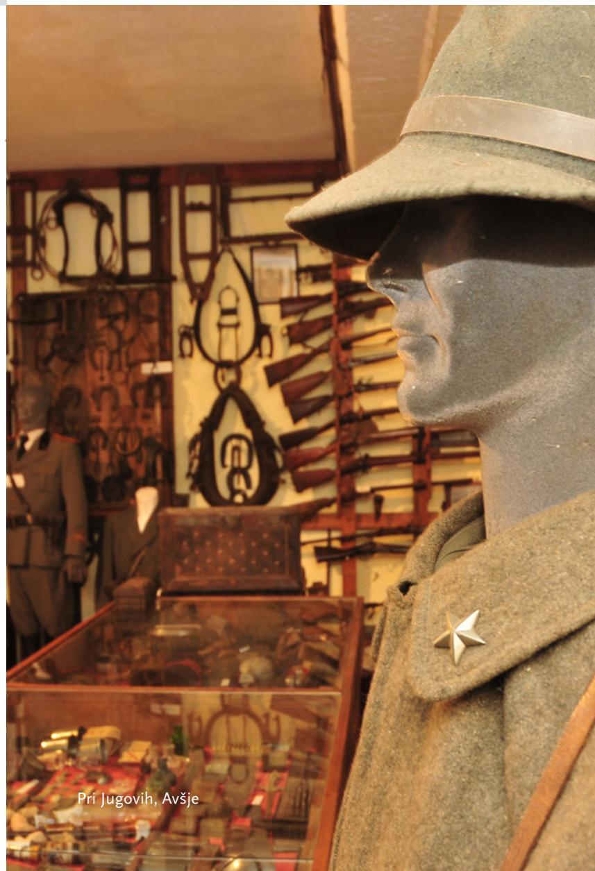
Pri Jugovih, Avšje

ČAS IZLETA / TEMPO DI PERCORRENZA / TOUR DURATION: 1 – 2 h