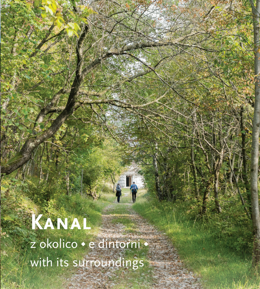
KANAL z okolico • e dintorni • with its surroundings

TRA IUSTITIA RAZVOJ DEDIŠČINE PRVE SVETOVNE VOJNE MED DELLA PRIMA GUERRA MONDIALE TRA LE ALPI E L'ADRIATICO / THE SUSTAINABLE DEVELOPMENT OF FIRST WORLD WAR HERITAGE BETWEEN THE ALPS AND THE ADRIATIC www.ita-slo.eu/WALKofPEACE